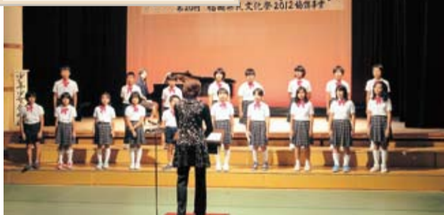
杷木少年少女合唱団