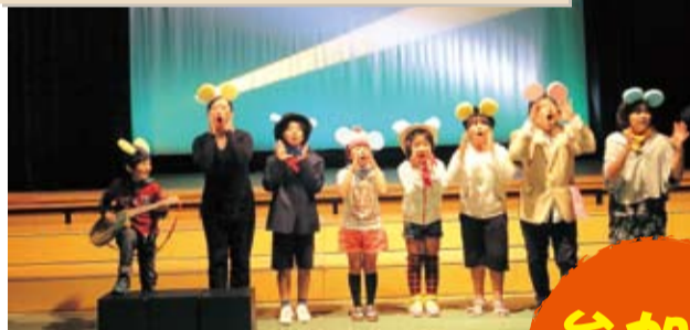
子ども未来館劇団たーびやらんず