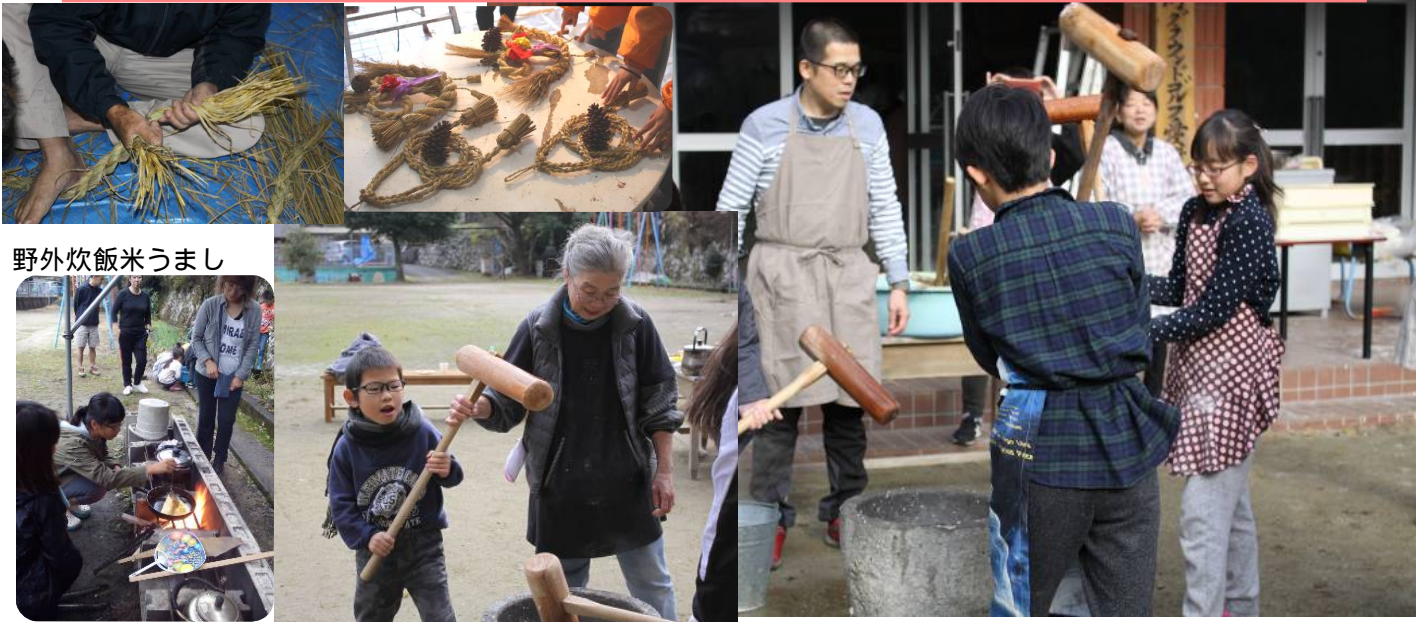
野外炊飯米うまし