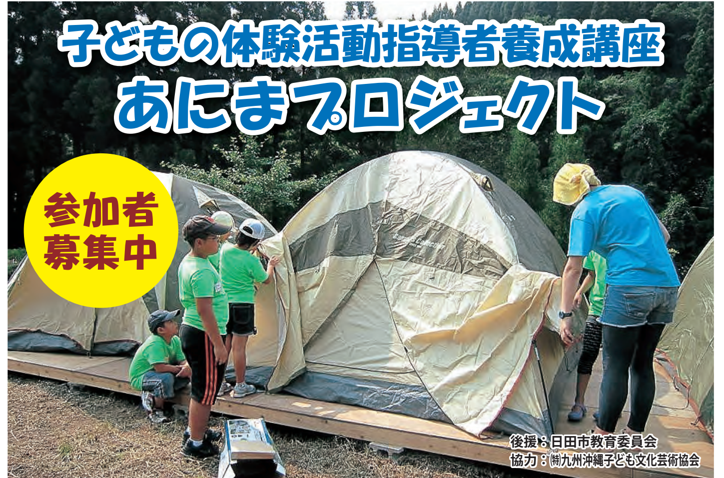
後援：日田市教育委員会 協力：(株)九州沖縄子ども文化芸術協会